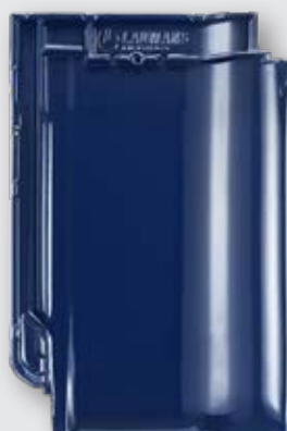
LAUMANS TIEFA XL TOP®