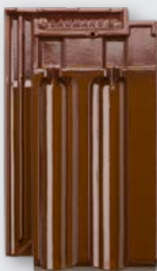
LAUMANS MULDEN VARIABEL