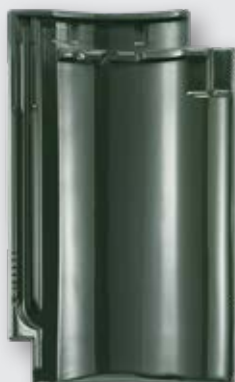
LAUMANS IDEAL VARIABEL

Ob naturrot, klassisch altfarben, in modernem, mattem Schwarz oder in einem eleganten, hochglänzenden Grünton – alle lebendig nuancierten Farben und Oberflächen unterstreichen in Verbindung mit dem charakterstarken Licht- und Schattenspiel des jeweiligen Dachziegelmodells immer die gesamte Architektur. Für die individuelle, hochwertige Optik Ihrer Immobilie. Nutzen Sie auch die Musterziegel-Bestellung auf unserer Webpräsenz: www.laumans.de