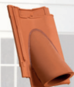
ENTLÜFTERZIEGEL MIT EDELSTAHLGITTER