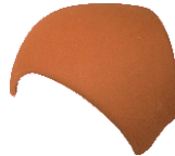
Walmkappe Nr. 3099 für Dachneigung von 16° - 50° Gewicht: ca. 5,0 kg