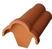
First-Anfangs-/Endziegel Nr.1002/100 Decklänge: ca. 320/340 mm Deckbreite: ca. 210 mm Gewicht: ca. 4,0/4,6 kg