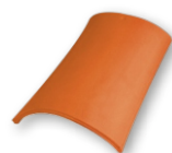
Konischer First* Decklänge: ca. 360 mm Deckbreite: ca. 225 mm Bedarf: ca. 3,0 pro m Gewicht: ca. 3,7 kg