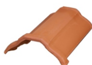
First Nr. 200 Decklänge: ca. 350 mm Deckbreite: ca. 210 mm Bedarf: ca. 3,0 pro m Gewicht: ca. 3,0 kg