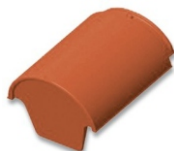
First-Anfangs-/Endziegel Nr. 3002/3003 Decklänge: ca. 330/315 mm Deckbreite: ca. 275 mm Gewicht: ca. 7,7/6,5 kg