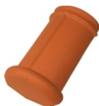
First-Anfangs-/Endziegel Nr. 302/303 Decklänge: ca. 330 mm Deckbreite: ca. 200 mm Gewicht: ca. 3,5/3,6 kg