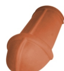
Vorstbeginpan voor hoekkeper Nr. 301 Deklengte: ca. 390 mm Dekbreedte: ca. 200 mm Gewicht: ca. 4,1 kg