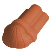
Vorstbeginpan voor hoekkeper Nr. 1001 Deklengte: ca. 370 mm Dekbreedte: ca. 210 mm Gewicht: ca. 3,2 kg