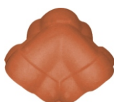
Broekstuk (uni kap) Nr. 1099 voor dakhellingen van 18° - 50° Gewicht: ca. 3,6 kg