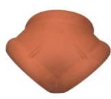
Broekstuk (uni kap) Nr. 399 voor dakhellingen van 16° - 50° Gewicht: ca. 3,3 kg