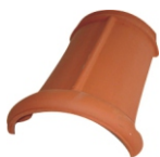
Vorst Nr. 300 Deklengte: ca. 320 mm Dekbreedte: ca. 200 mm Benodigd: ca. 3,0 per m Gewicht: ca. 2,9 kg