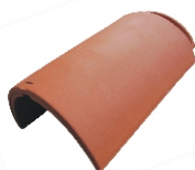
Vorst Nr. 3000 Deklengte: ca. 385 mm Dekbreedte: ca. 275 mm Benodigd: ca. 2,7 per m Gewicht: ca. 5,0 kg