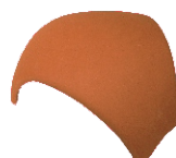
Broekstuk (uni kap) Nr. 3099 voor dakhellingen van 16° - 50° Gewicht: ca. 5,0 kg