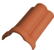
Vorst Nr. 1000 Deklengte: ca. 375 mm Dekbreedte: ca. 210 mm Benodigd: ca. 2,7 per m Gewicht: ca. 3,4 kg