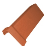
Universeel chaperonpan Nr. 6800** Deklengte: ca. 400 mm Dekbreedte: ca. 193 mm Benodigd: ca. 2,5 per m Gewicht: ca. 3,6 kg